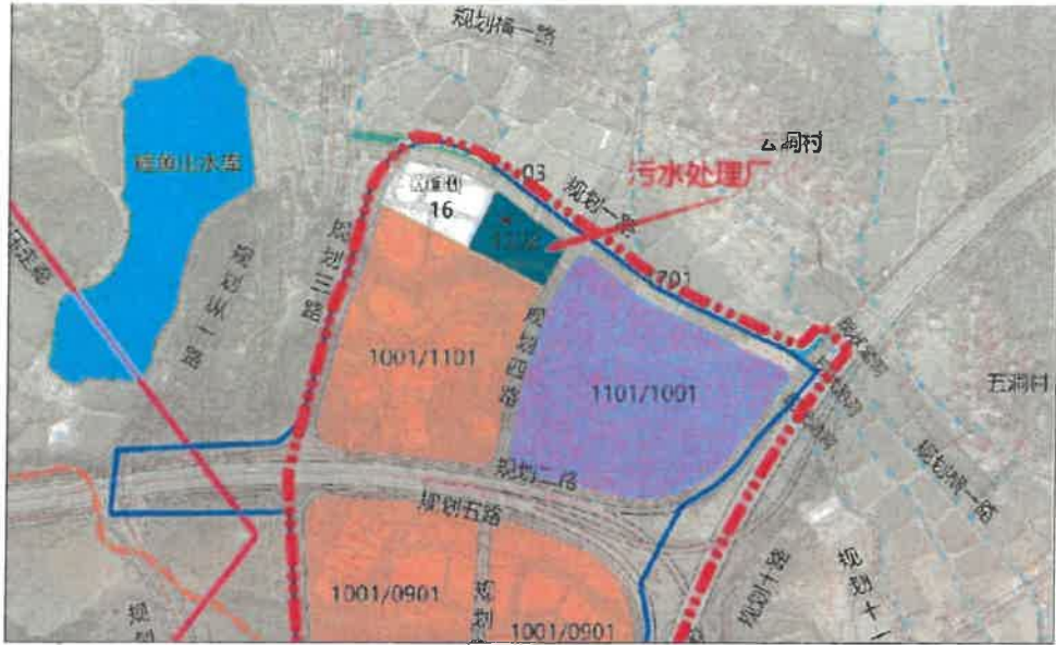
图一：拟建污水处理厂选址图

建设周期：项目建设周期约 18 个月，计划 2023 年 7 月开始破土动工，预计 2024 年 8 月底完成。